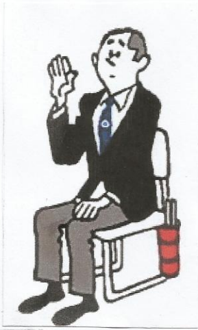
LE JUGE SIGNALE SON OPINION